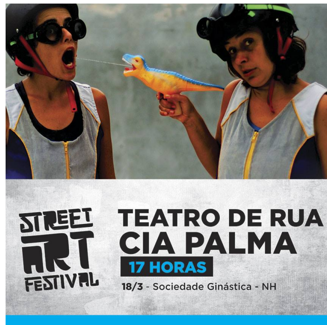
Street Art Festival, Novo Hamburgo, Brazil - 2017