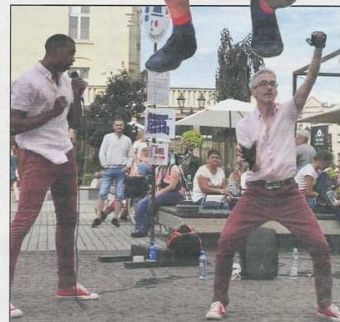
Aktorzy nawiązywali doskonały kontakt z widzami

Niecodzienni goście przez 3 dni dawali z siebie wszystko i wciągali widzów w swoje scenki i krótkie spektakle. Było wiele śmiechu. Publiczność z nieskrywanym podziwem obserwowała występy, które często były prawdziwymi show. (mac)