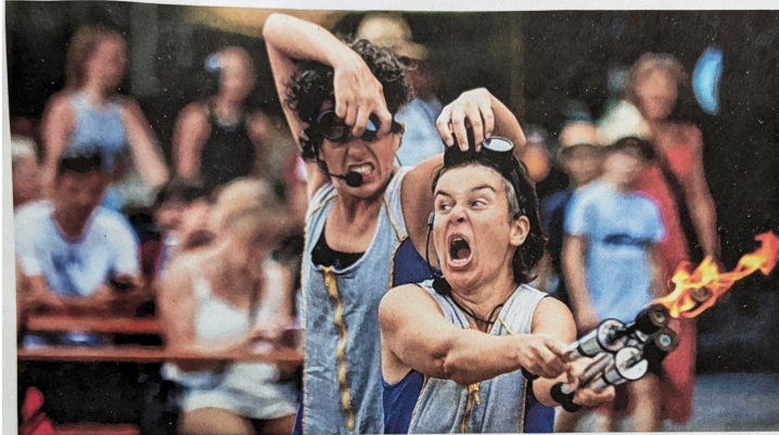
Spektakel und Spaß - das war reichlich geboten bei der diesjährigen Auflage von Kultur auf der Straße in Neu-Ulm.