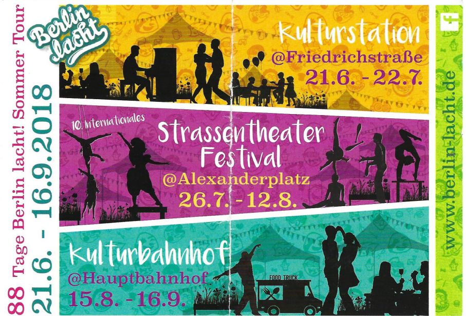
Berlin Lacht, Berlin, Germany - 2018