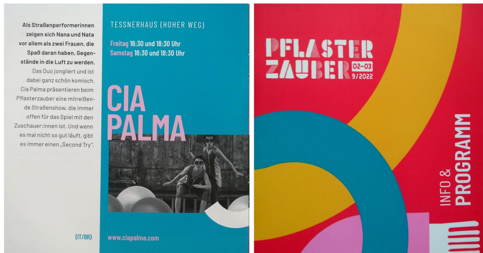
PflasterZauber Internationales Zirkus Theater Tanz Festival, Hildesheim, Germany - 2022