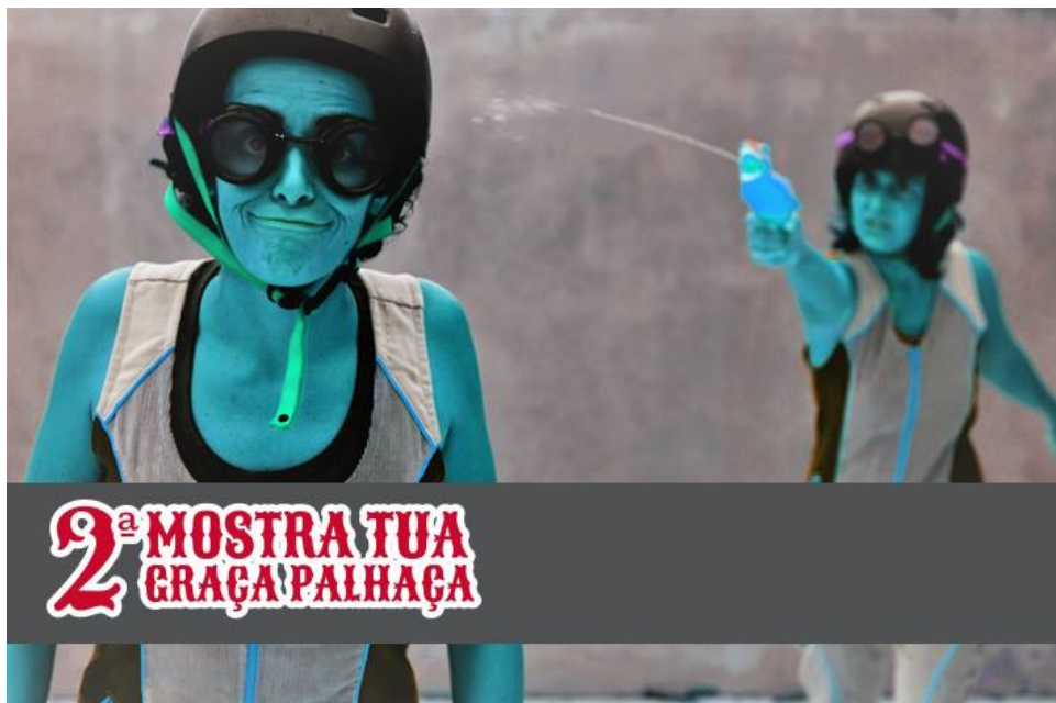
2ª Mostra Tua Graça Palhaça, Porto Alegre, Brazil - 2017